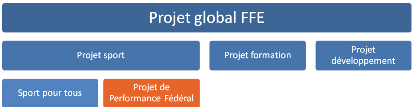
Schéma général du PPF

Dans sa mise en œuvre, la direction technique nationale porte une attention particulière à mettre en corrélation les orientations ministérielles et les directives de la politique sportive fédérale.