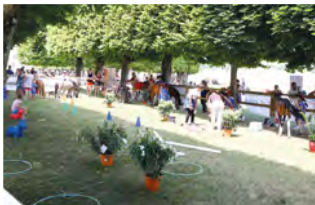
Les déclinaisons de l'équifun permettent des parcours découverte attractifs.

Pour une approche « verte », faites d'une pierre deux coups en organisant un parcours nature à pied avec le cheval. Les fiches développement durable vous proposent de nombreuses idées. Voir ffe.com / Développement durable / Outils clubs / Fiches pratiques .