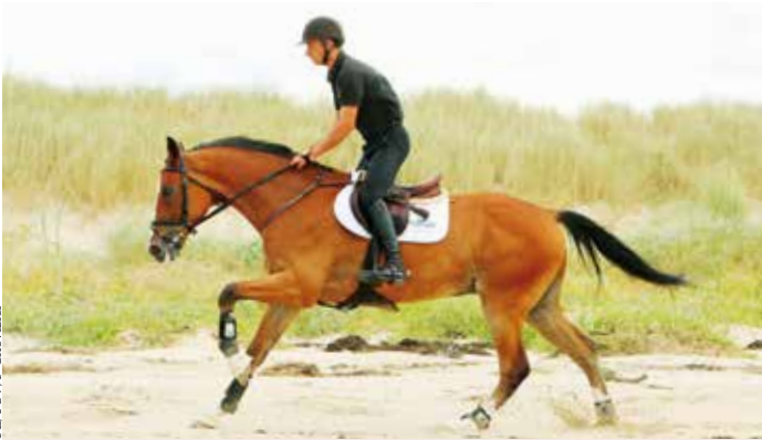
Sur la plage de Saint-Martin-de-Bréhal.