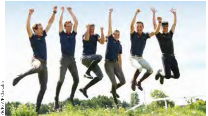
Avec l'équipe de France des Europe 2015.

au quotidien, en plus des cours à donner : c'est un nombre sans doute moins important que celui dont s'occupent mes confrères du civil, qui parfois ont chez eux quinze ou vingt chevaux, mais étant donné les autres missions que nous sont confiées, nous ne pouvons pas aller au-delà.»