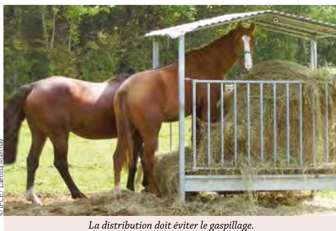
La distribution doit éviter le gaspillage.

Il est parfois délicat d'évaluer la quantité distribuée au box : le peser pour savoir permet d'éviter les erreurs grossières ! Fractionner la ration en 2-3 repas permet d'adapter les quantités dis-