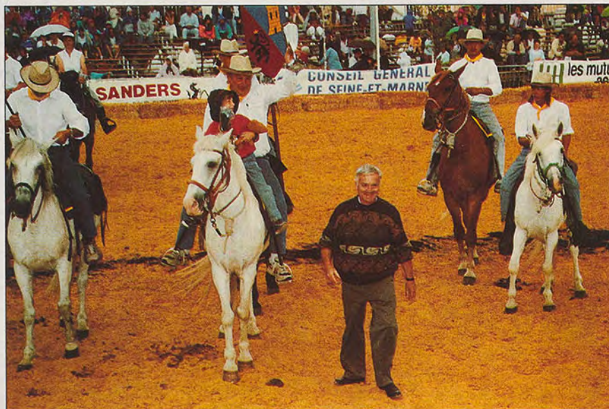
"Un Président heureux"

Venez voir si la hotte du père Noël est pleine. Réservation: Tarif enfant de 4 à 12 ans 50 F Adulte 80 F (Possibilité tarif pour groupes) Haras national des Bréviaires 78610 Les Bréviaires Tél 34 84 92 07