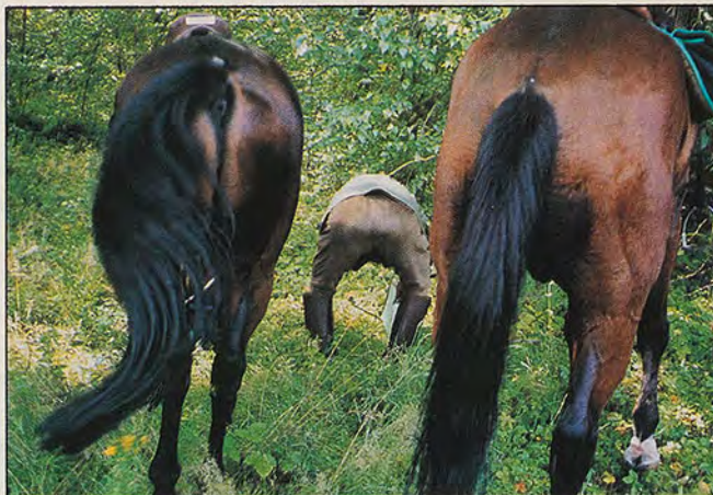
"Les 3 croupes"

Les prix seront remis au Salon du Cheval et du Poney de Paris, sur le stand de l'ANTE, le jeudi 9 décembre 93.