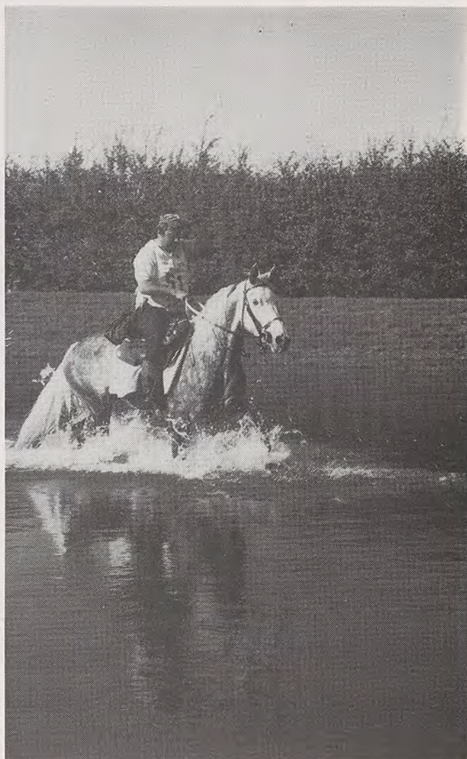
LA REGION PARISIENNE REGORGE DE PARCOURS INSOLITES

troncs de chênes au garde-à-vous." "Ces lieux de repos et de réconfort, où nous trouvâmes ce qui manque le plus à deux solitaires, la chaleur animale pour lui et humaine pour moi, je les découvris en compulsant une saine littérature ramassée en 89, sur les stands ANTE du Salon du Cheval : "Chevauchées en Ile de France" et "Hébergements équestres en Ile de France" par l'ARTEIF, et la brochure DNTE "Tourisme équestre en France".