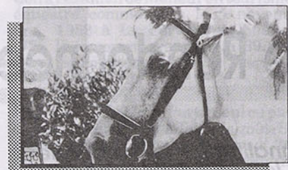
Ouassal devient le symbole français de la reconnaissance du cheval barbe

L'étalon Ouassal, cadeau de l'Algérie en 1975 au président Valéry Giscard d'Estaing, stationné depuis au haras du Pin (Orne), a été mis à la disposition des éleveurs par l'administration des haras nationaux. Cette décision fait suite à la reconnaissance officielle de la race barbe en vertu d'un arrêté du Ministère de l'Agriculture.