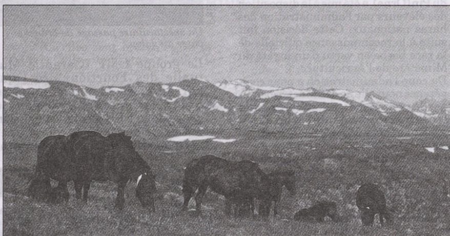
La randonnée: pour aller à la découverte de vastes horizons

De plus, la prise en considération par les Pouvoirs publics de tous niveaux de l'importance philosophique, numérique et économique de la C.F.R. conforte les représentants nationaux et régionaux dans leur intention de poursuivre l'action commune.