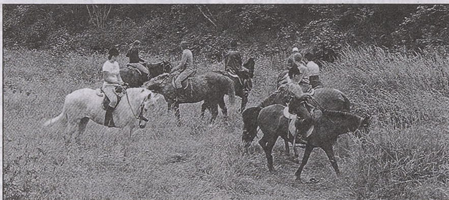
Cheval, homme, nature: les éléments du tripléide...

Nous y voilà, tout ce discours pour en arriver à vous dire combien j'avais envie de vous parler du cheval, et de la nature qu'il incarne. Vous parler du cheval parce qu'il m'arrive de penser plus à lui qu'à ses «utilisateurs». Vous parler de la nature parce que notre équitation «de loisirs», «de randonnée», ramène les «utilisateurs» que nous sommes à nos propres sources. «Cheval-Nature-Homme». Tout est dit, les éléments du tripléide (1) sont réunis, biologiquement parlant. Réunis, parce que chacun d'eux a besoin des autres. La preuve? Regardez «l'homme-ville»: béton-bitume-auto-boulot-télé-dodo. Résultat: déséquilibré, blasé, démusclé, déprimé. Tournez-vous vers le «cheval-boîte»: litière-ennui-ration-sciure-manège. Résultat: tics, humeurs, tristesse, problèmes.