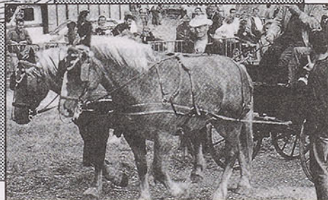
Arrivée au bivouac dans le cadre somptueux du parc de Floyrac.

Bravo à tous les meneurs pour leurs superbes prestations d'attelage!