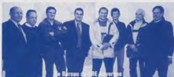
Le Bureau du CREA Auvergne

CSO, CCE, Dressage, Pony-Games, Attelage, Voltige, Horse-Ball, TREC, Endurance, Hunter, Commission Instruction Pédagogie, Commission Elevage, Commission Communication, Commission des Affaires Sportives. Une action sportive avec élaboration des procédures réglementaires, un calendrier régional, une mise en place des sélections, animer et coordonner les actions de terrains, la détection de cavaliers, un circuit d'information.