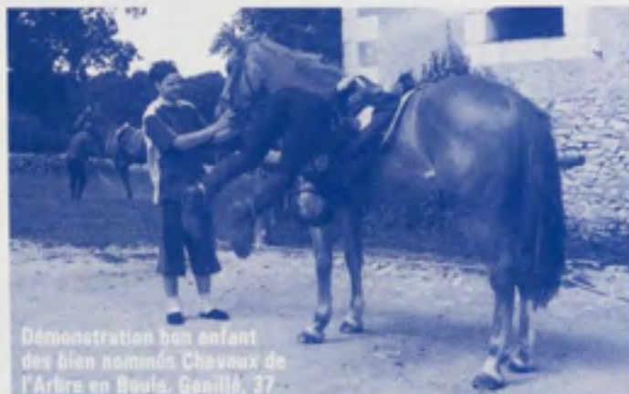
Démonstration bon enfant des bien nommés Chevaux de l'Arbre en Boule. Genillé, 37.

Cette opération a connu un réel succès. Une dizaine d'inscriptions ont été prises ce jour là. - CH