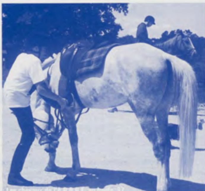
Les chevaux de l'A.R.S.F.E. au travail. 37

La licence est prévue pour être prise en septembre et renouvelée entre le 1er septembre et le 31 décembre. Cela donne 4 mois de superposition de validité pour renouveler sa licence. Il n'y a pas de délai de prolongation d'assurance au-delà du délai de 4 mois. Expliquez bien à vos cavaliers qu'ils doivent renouveler leur licence avant le 31 décembre, DERNIER délai.