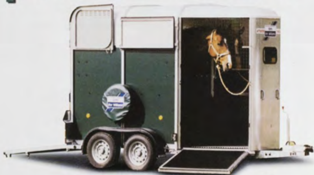
Marque Ifor Williams (modèle de luxe)

Pour jouer, c'est simple, rendez-vous dans le magazine TÉLÉ POCHE en vente les semaines du 8 et du 15 octobre