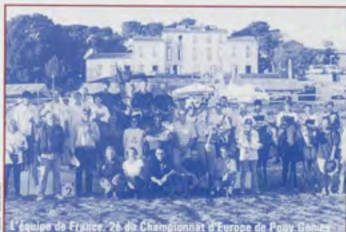
L'équipe de France, 2e du Championnat d'Europe de Pony-Games

De façon très claire, très visuelle, à l'aide de courbes et de cartes, des données sur les étalons, les saillies, les poulinières, les élevages, les immatriculations sont présentés pour chaque race et chaque registre. Haras Nationaux, Direction de la filière, BP 3, 19231 Arnac Pompadour cedex. 4,57 € (30 F) + 1,52 € (10 F) de frais d'envoi. - FG