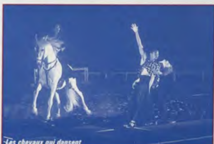
Les chevaux qui dansent