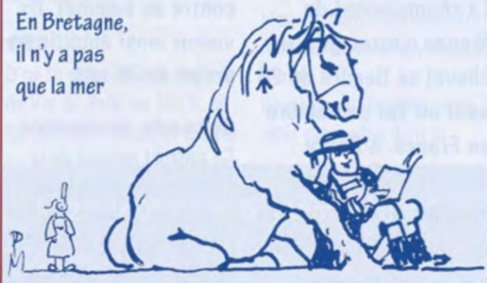
Dessin : Philippe Meyrier