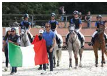
L'Italie remporte le Mondial des clubs