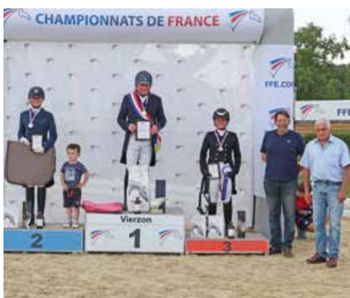
Le podium Pro 2