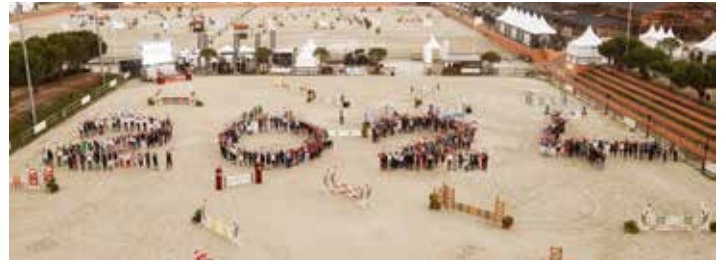
Le 2024 A cheval pour Paris