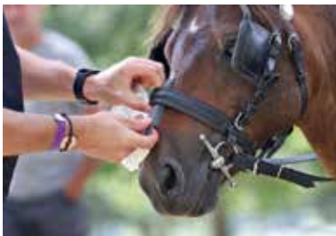
Vérification de muserolle