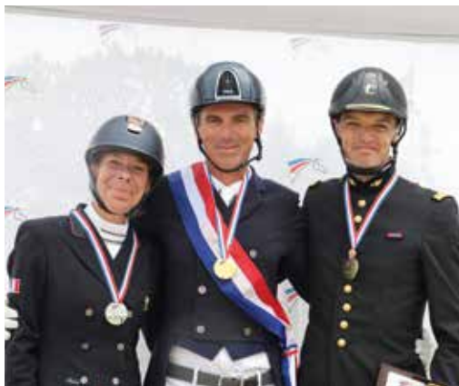
Le podium Pro Elite