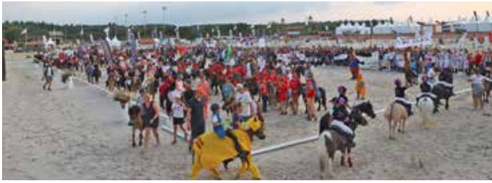
La cérémonie d'ouverture