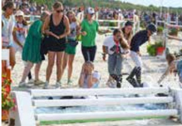
Baptême de la médaille dans le bidet