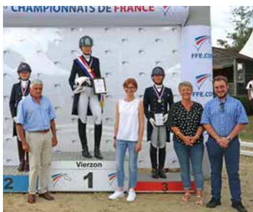
Le podium Pro 1