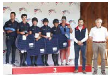
La France est 3 e