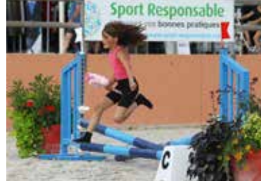
Hobby horse très enthousiaste