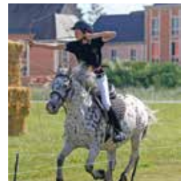
Tir à l'arc à cheval

des disciplines qui se côtoient sans se télescoper. Pour eux, la France est un modèle de rêve.