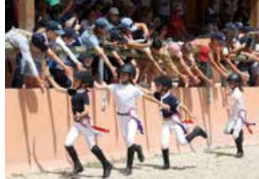
Tour d'honneur des médaillés