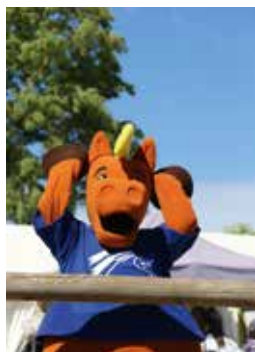
Trop Top a été de toutes les fêtes