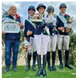
CCIO 4*S de Jardy