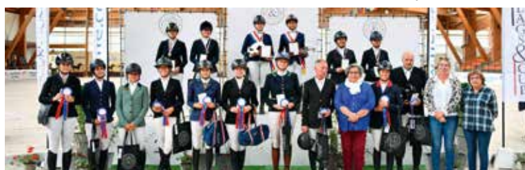
CCE Amateur Elite jeunes seniors