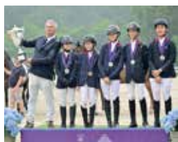
Europe Gorla Minore