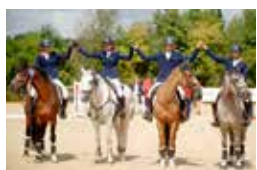
Europe au Mans

Voir composition des équipes réunies sur la photo et compte-rendu dans les actualités de ffe.com .