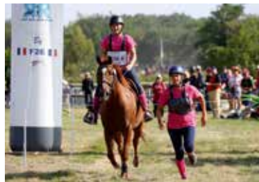
Ride & Run