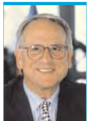
H Serandour, président du CNOSF