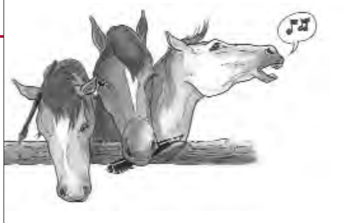
Dessin : Xavier Saüt

Au Pin dans l'Orne, avec ses activités d'animation, la médiathèque de l'Ecole nationale professionnelle participe également, en partenariat avec la région, aux missions pédagogiques des Haras. Elle entretient un partenariat avec la Bibliothèque départementale de l'Orne qui s'ar-