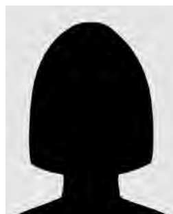
Delphine POULET Guadeloupe