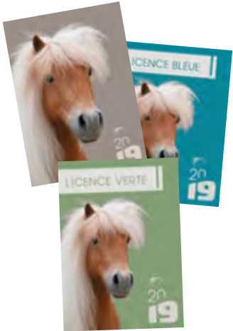
Licences 2018 pratiquant, verte et bleue

AU-DELÀ DE L'OBLIGATION, LA LICENCE OFFRE DE MULTIPLES ATOUTS POUR LE CAVALIER ET POUR LE CLUB. ARGUMENTAIRE À RELAYER SANS MODÉRATION EN CETTE PÉRIODE DE RENTRÉE.