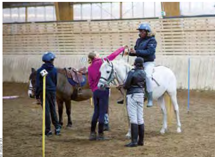
A l'image de l'opération, nous sommes tous la République dans le 95, le BFE Equi-social met le monde du centre équestre au service des valeurs citoyennes

L'accueil traditionnel complété par la prise en charge pédagogique de ces publics vise à favoriser la socialisation, à sensibiliser à un nouvel environnement, à faire vivre de nouvelles expériences, à faire acqué-