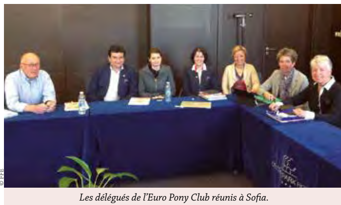
Les délégués de l'Euro Pony Club réunis à Sofia.

Outre la création d'une Newsletter trimestrielle et la mise à jour du site http://europonyclub.eu , un premier séminaire sera organisé par la fédération bulgare du 24 au 28 octobre 2016 à Sofia. Les 3 thèmes sont la formation à l'équitation active et ludique pour les enseignants, le travail des petits poneys et les activités d'animation dans les clubs. La France est missionnée pour préparer le contenu pédagogique et technique de ce séminaire et pour l'animer.