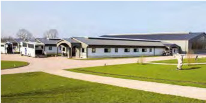
Vue d'ensemble du Haras des Coudrettes