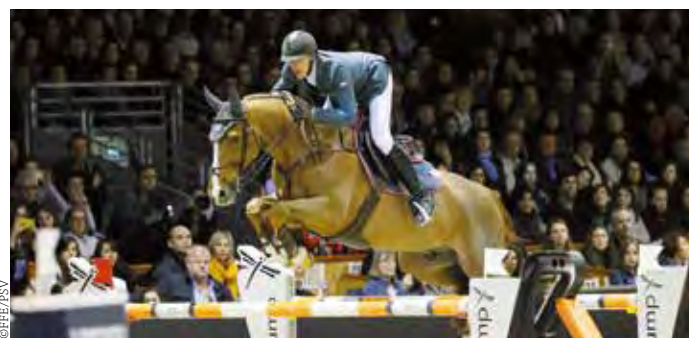
Vainqueur du GPW de Bordeaux avec Rêveur de Hurtebise*HDC-JO/JEM

Partenaires officiels : Haras des Coudrettes, Jump Five, Rolex, Smuggler. Fournisseurs officiels : Animo, Clean Box, CWD, Equistro, Freejump, Horseware, Lambey, Samshield.