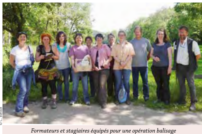
Formateurs et stagiaires équipés pour une opération balisage

Des ateliers de mise en situation de formateur ont permis aux stagiaires d'expérimenter leur futur statut et de bénéficier des commentaires très instructifs des formateurs.