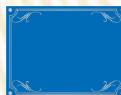
CADRE N° 3