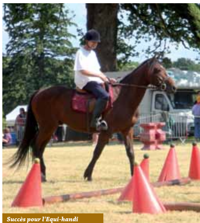
Succès pour l'Équi-handi

Avec un total de 250 participants, la réussite de ces rencontres est au rendez-vous.