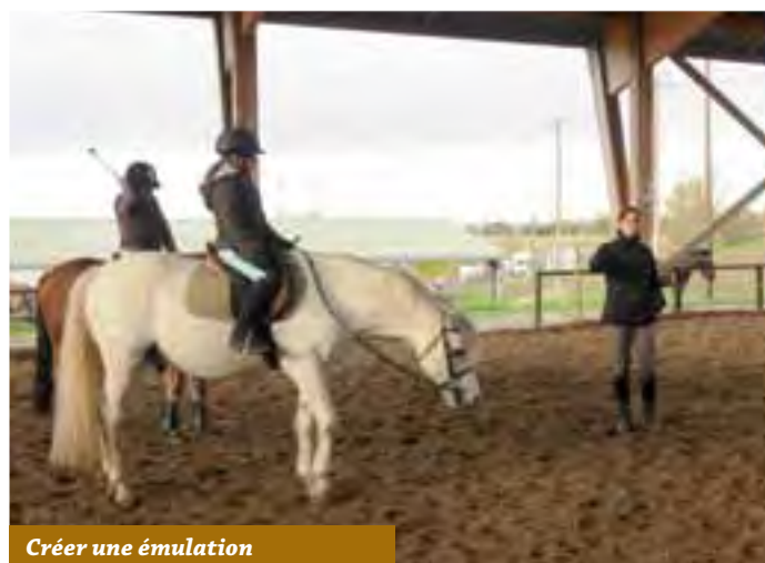
Créer une émulation

Afin de faire se rencontrer leurs cavaliers et d'associer les familles à leur pratique, elles ont créé ensemble les rencontres « Equi-Famille ». L'objectif de l'opération, est que ces cavaliers et ces familles disséminés sur un territoire rural tissent des liens. C'est grâce à ces animations que les deux ensei-