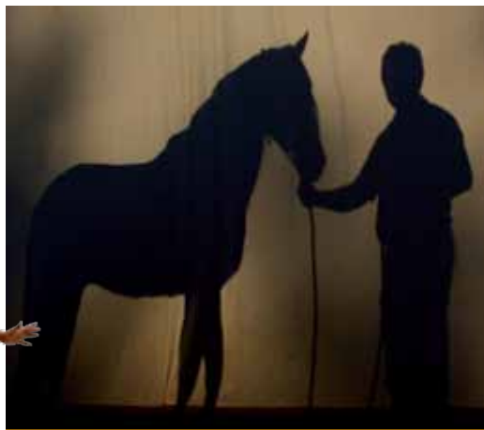
Découvrir les jeux d'ombre et de lumière

Poney Passion : vidéo de la présélection des spectacles retenus pour Poney Passion, mise en lumière et enfin représentation. Un enseignant et un professionnel du spectacle seront présents pour répondre à toutes les questions.