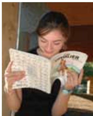
Potasser son hippologie, un must pour tous.

■ FILIERES : Dès le Galop 5, les spécialités sont des filières. On doit avoir son Galop 5 western pour pouvoir se présenter au Galop 6 western. Les spécialités