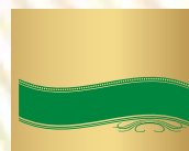
CADRE N° 4