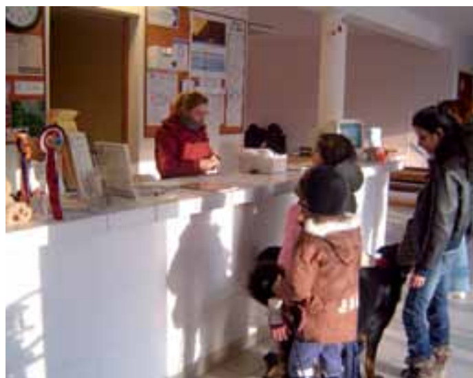
Informez vos cavaliers sur les points clé lors de l'inscription

Lorsque vous recevez du public, vous devez faire connaître et faire respecter les règles de sécurité, de circulation, de comportement applicables au sein de votre établissement.