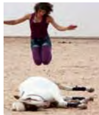
Le spectacle, ou plaisir pour petits et grands