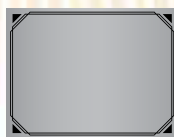
CADRE N° 2