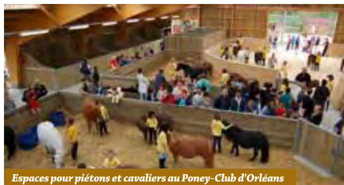
Espaces pour piétons et cavaliers au Poney-Club d'Orléans

Aujourd'hui, un centre équestre accueille non seulement ses cavaliers au sein des espaces