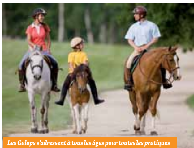
Les Galops s'adressent à tous les âges pour toutes les pratiques

■ DEGRES : Les Degrés abordent des compétences d'homme de cheval. Ils vous permettent de bénéficier de la reconnaissance d'un approfondissement de vos compétences par la validation formelle de vos acquis. Ce sont les Comités Régionaux d'Équitation qui mettent en place les sessions d'examens pour assurer l'harmonisation de l'évaluation des acquis par des références nationales homogènes.