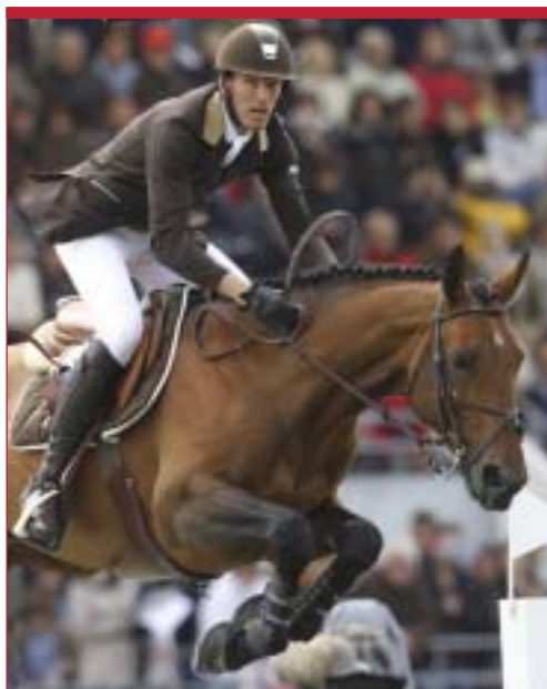
Kevin Staut et Kraque Boom

3 podiums pour la voltige, la pole position confortée pour le saut d'obstacles dans la Meydan FEI Nations CUP et des performances significatives dans les Grands Prix avec une première, la victoire de Kevin Staut dans le Best of Champions d'Aix-la-Chapelle.