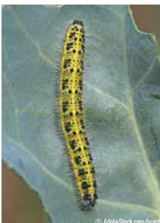
Pieride du chou

— Zut, se dit O'Freez, ça sonnait plutôt bien... Il faudra donc se contenter du chiendent !