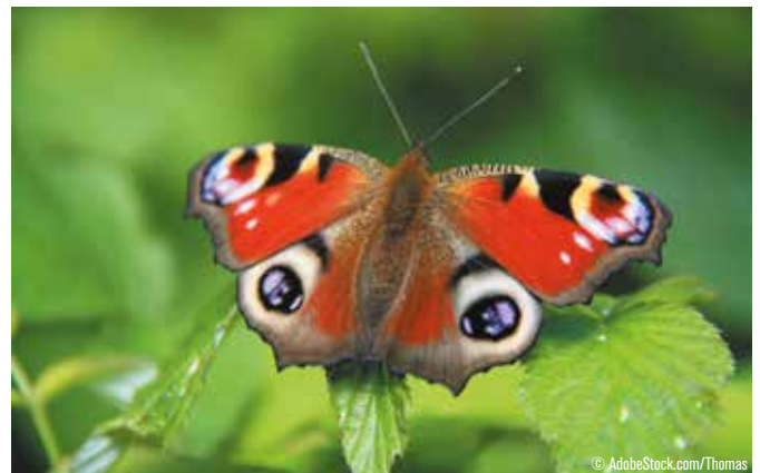
Paon de jour

Le cycle de vie des papillons se caractérise par le phénomène de métamorphose. Des œufs, sortent des chenilles qui se nourrissent du support qui leur a servi de refuge. Les chenilles sont souvent des proies faciles, aussi certaines ont développé des mécanismes pour se protéger. Elles peuvent se camoufler, comme la phalène du bouleau qui