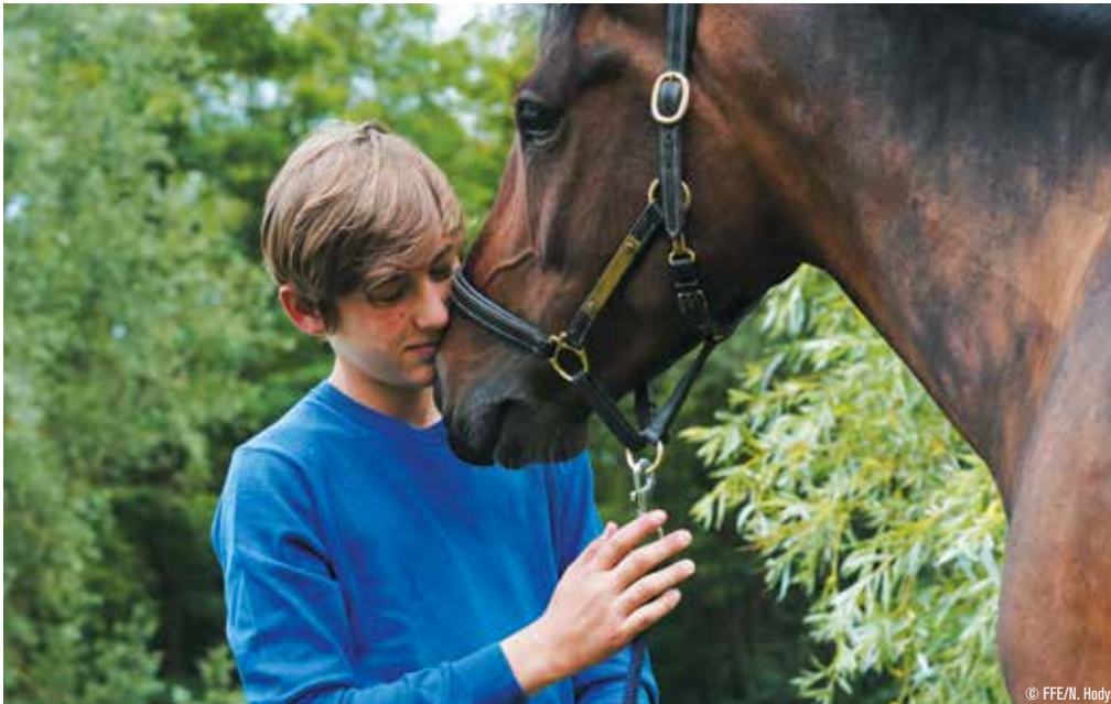
Paroles, contact physique, récompense sont la base de la confiance.

cheval de Selle français. L'art du menage se retrouve en sommeil, une sorte de confinement. C'est le prince Philip, Président de la Fédération équestre internationale (FEI) qui relance l'attelage dans les années 1970 en initiant les concours complets sportifs. En France, notre fédération équestre donne à l'Association française d'attelage (AFA) la responsabilité de créer les premiers concours, de mettre au point les examens pour mener à un, en paire, à quatre et en tandem. En 1979, la France organise au Haras du Pin ses premiers championnats d'Europe avec l'aide des Haras nationaux.