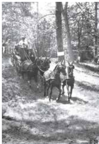
Début de l'attelage sportif.

ment un véhicule hippomobile) procure une proximité physique et affective partagée qu'aucune auto ne pourra jamais apporter. On vante l'avenir de l'auto sans chauffeur. Nous, notre cheval fera toujours équipe avec son meneur ou son cavalier. C'est pour cela qu'il est un compa-