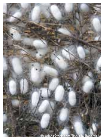
Bombyx du mûrier