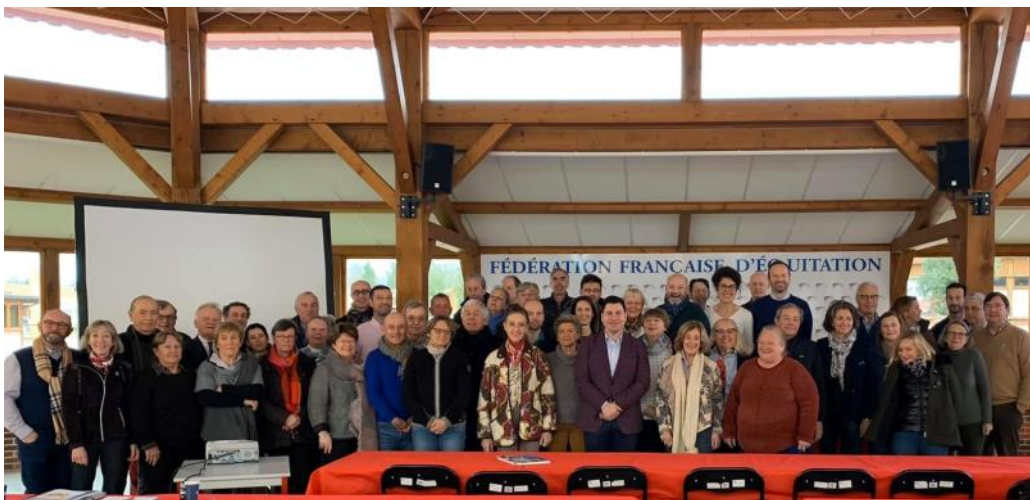
Près de 55 juges de dressage ont répondu présent à l'appel de la FFE.

Les participants ont apprécié ces deux jours de séminaire passés dans un esprit convivial et ont souligné la qualité des interventions. De nombreux officiels avaient fait le déplacement et ont rappelé la nécessité de ce genre de rassemblements.