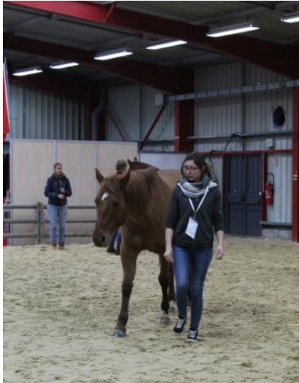
Atelier médiation avec les équidés.