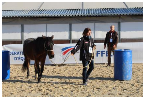
Atelier évoluer à pied avec son cheval.