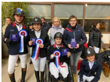
L'équipe de France 2 e de la Coupe des nations.

Première sortie internationale pour les para-dresseurs qui avaient rendez-vous la semaine dernière au CPEDI 3* de Mâcon, tout nouveau Concours para-équestre de dressage international organisé par l'équipe du Pôle hippique de Mâcon-Chaintré. Avec neuf nations et 31 couples au départ, la compétition avait une importance toute particulière pour les Tricolores, celle de glaner encore quelques précieux points pour une qualification aux Jeux paralympiques de Tokyo (JAP). Deux places en individuel sont encore en lice ainsi qu'un ticket par équipe. Les compteurs s'arrêtant le 1 er février, après Mâcon, le CPEDI 3* de Genemuiden (NED), qui se tiendra du 30 janvier au 1 er février, représentera la dernière chance de décrocher un billet pour le Japon.