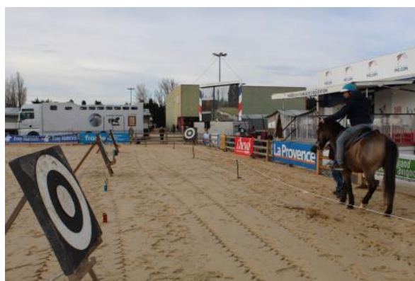
Le tir à l'arc à cheval a été testé lors du Grand Club.

En savoir plus sur la page du Congrès, les interventions et les captations vidéos seront mises en ligne prochainement : ICI .