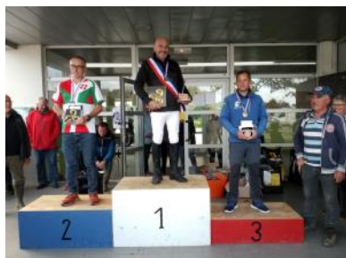
Le podium du Championnat de France Major Amateur Élite.

Les Amis du cheval du Goelo organisaient le week-end du 28 et 29 septembre le Championnat de France d'endurance Major Amateur Élite réservé aux cavaliers âgés de plus de 40 ans.