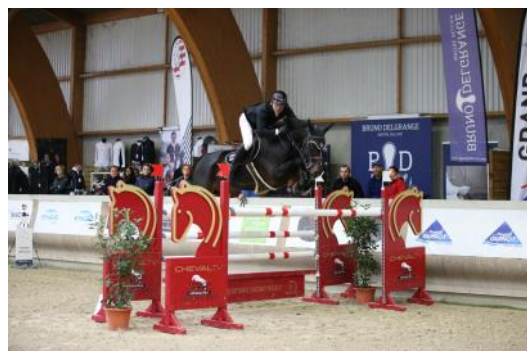
Thomas Lambert et Univers de Ch'ti .