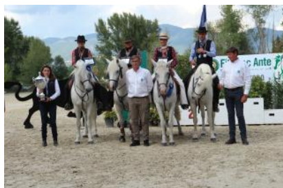
L'équipe de France Seniors.

Le Championnat d'Europe d'équitation de travail et de tradition s'est tenu du 3 au 6 octobre à Narni en Italie. La France repart avec deux médailles par équipe : l'argent pour les Seniors et le bronze pour les Juniors.