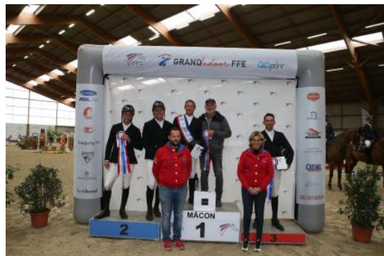
Le podium de la 1 ère étape du Grand Indoor FFE-AC Print.