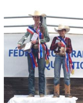
Le podium de la Club 1.