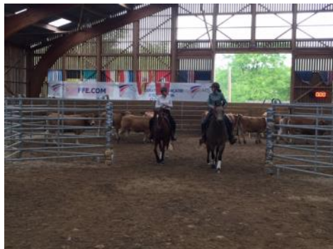
Le ranch sorting est une épreuve de tri de bétail.

Le Championnat de France de ranch sorting s'est disputé le week-end du 5 et 6 octobre au domaine de la Fleurière à Montarnaud (34) organisé par l'Écurie New Way. Trois titres ont été décernés.