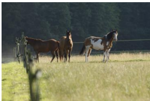
Tout au long de sa vie, le cheval a besoin d'être en contact avec ses congénères.

Source sevrage progressif : http://www.phase.inra.fr/Toutes-les-actualites/separation-progressive-poulain-mere