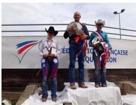
Le podium de l'Amateur 1.