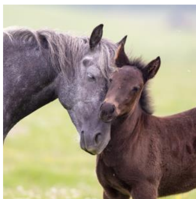
La mère est un modèle pour le poulain.

Avant de pouvoir être monté, de nombreuses étapes jalonnent l'évolution d'un cheval. L'Homme doit respecter certaines règles cruciales dans son éducation. La qualité des interactions futures en dépend.