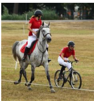
Le « Ride and Bike » nouvelle discipline 2019

Chaque jour, deux sujets Cheval TV ont été réalisés pour vous faire découvrir l'évènement comme si vous y étiez. Retrouvez tous les sujets ici : https://www.chevaltv.fr/ffe/open-de-france