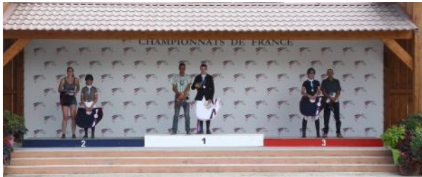
Podium CSO Club Elite excellence Seniors Jeunes Seniors

Le Generali Open de France s'achève pour les 15 500 cavaliers venus courir leur championnat de France d'équitation Poneys et Clubs au Parc équestre fédéral à Lamotte-Beuvron. Grand rassemblement pensé pour tous les poney-clubs et centres équestres de France, le Generali Open de France constitue un objectif annuel pour des milliers de cavaliers. Cette édition 2019 a tenu ses promesses.