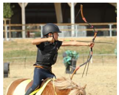
Le tir à l'arc à cheval rencontre un grand succès auprès des cavaliers.