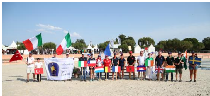
Défilé des nations en ouverture du Mondial des clubs