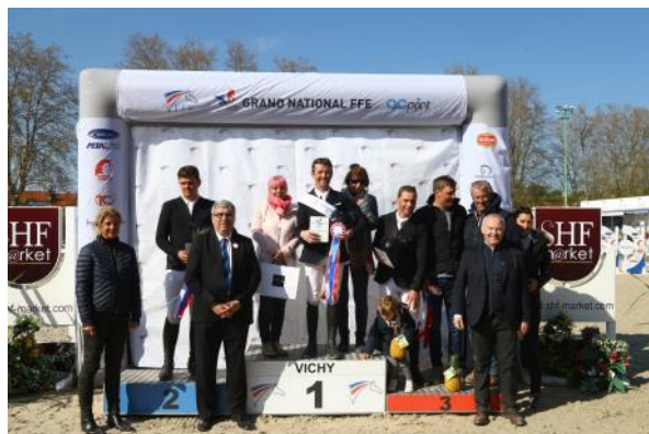
Le podium de la 3 e étape du Grand National FFE-AC Print.