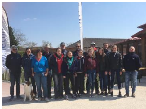
Le groupe des cavaliers de l'équipe de France et le staff fédéral réunis au Parc équestre fédéral.

La FFE a réuni 13 cavaliers membres des équipes de France de reining Juniors, Jeunes cavaliers et Seniors à Lamotte-Beuvron (41) les 13 et 14 avril. Ils ont pu profiter pour la première du grand manège du Parc équestre fédéral. L'occasion de faire un état des lieux des cavaliers et de leurs chevaux pour cette saison dont l'échéance majeure sera le championnat d'Europe Seniors et les championnats du monde jeunes qui se tiendront cet été à Givrins (SUI).