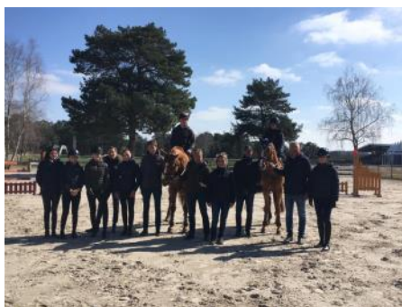
Le staff fédéral et les Juniors.

Des échanges et moments conviviaux pour organiser au mieux la première échéance internationale de l'année : le CSIO d'Opglabbeek qui se déroulera du 3 au 7 avril avec les Coupes des nations le samedi 6 et dimanche 7.