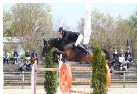
Thomas Lambert et Univers de Ch'ti.