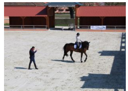
Une démonstration de para-dressage a été commentée par Philippe Célérier.

Retrouvez toutes les informations sur Cheval et diversité : ICI