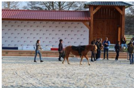
Les soignants se sont essayé aux longues rênes.