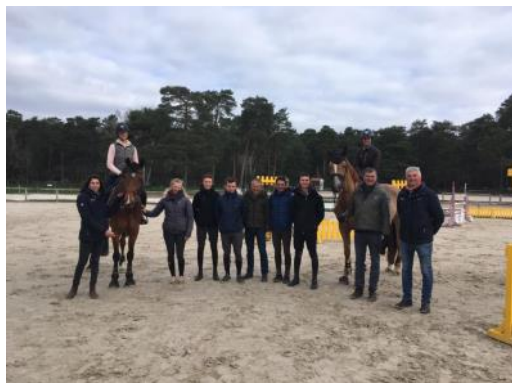
Le staff fédéral et les Jeunes cavaliers ont bien travaillé en vue du CSIO de Belgique.

La Fédération Française d'Équitation a organisé un stage de préparation pour les équipes de France Juniors et Jeunes cavaliers lundi 25 et mardi 26 mars à Fontainebleau à quelques jours du premier CSIO de l'année à Opglabbeek (BEL).