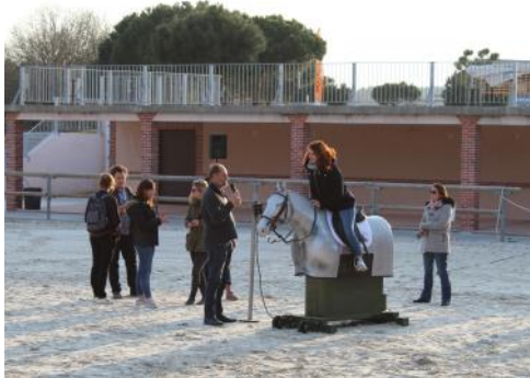
Les soignants ont pu tester le simulateur électro mécanique.

Le Congrès Cheval & Diversité « Le cheval partenaire de santé, de la prévention à la reconstruction » des 28 et 29 mars a réuni 150 personnels soignants et enseignants de centres équestres. Les deux jours de conférences et de débats avaient pour but d'enrichir leurs connaissances en Médiation avec les équidés, MAE, et d'échanger sur la mutualisation d'outils et de pratiques afin de mieux accompagner tous les publics.