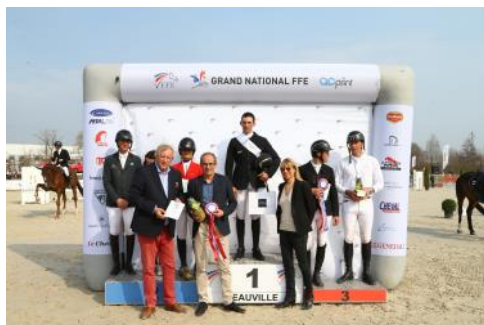
Le podium de la 2 e étape du Grand National FFE-AC Print à Deauville.