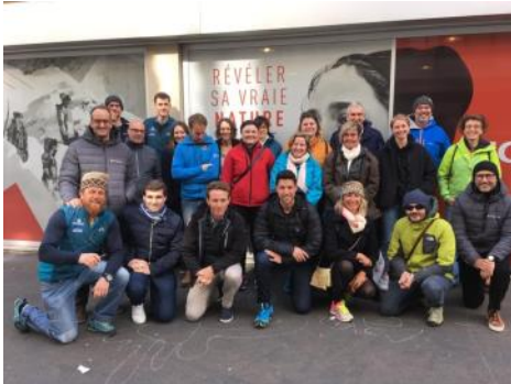
Partenaires du Consortium BOSS et responsables des 12 structures qui testeront l'outil de mesure des bénéfices sociaux.

La Fédération Française d'Équitation et la Fédération Internationale de Tourisme Equestre (FITE), dans une démarche de concertation avec les autres acteurs des loisirs sportifs de nature, participent au projet Benefits of Outdoor Sports for Society (BOSS).