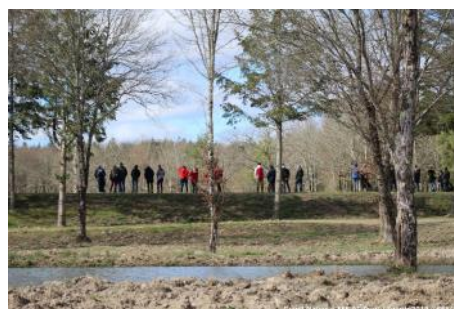
La cross du Mont d'Aunay attire toujours beaucoup de monde.