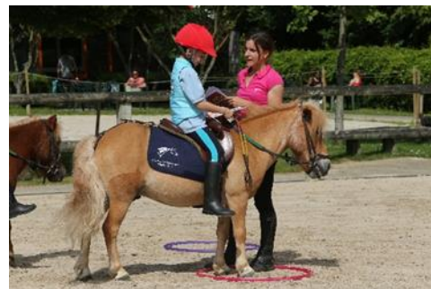
Le jeu du marché.

Le jeu est un moyen et non une fin en soi. La technique équestre, la qualité des explications, l'adaptation des attitudes et l'évaluation de la progression par l'enseignant restent primordiales.