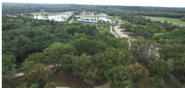
Vue aérienne du cross du Mont d'Aunay.

Habituellement organisée en septembre, l'étape du Grand National de concours complet à Lamotte-Beuvron (41) a été avancée cette saison au mois de mars. Ses installations et notamment le cross du Mont d'Aunay offrent la possibilité à la FFE d'accueillir un tel événement tout au long de l'année.