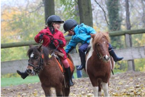
Le plaisir pris par l'enfant lors de jeux favorise son apprentissage.

Quand les enfants viennent au monde, ils ont tout à découvrir. L'une des façons qu'ils ont pour apprendre à se développer est le jeu. Les 6 000 poney-clubs et centres équestres de la Fédération Française d'Équitation s'inscrivent dans une démarche éducative. Ils proposent aux enfants dès l'âge de trois ans de découvrir l'équitation à travers le jeu à poney.