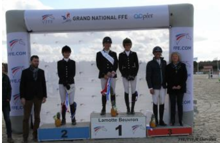
Le podium de la 1 ÈRE étape de concours complet du Grand National FFE-AC Print.