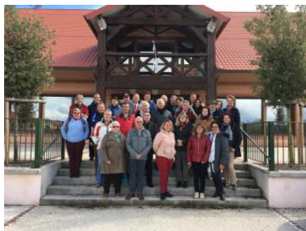
Les stewards de dressage et de saut d'obstacles réunis au Parc équestre fédéral.

La Fédération Française d'Équitation a organisé les 16 et 17 mars au Parc équestre fédéral un cours FEI destiné aux stewards de dressage et de saut d'obstacles. Vingt-six officiels ont fait le déplacement en Sologne.