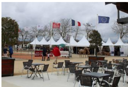
Le Parc équestre fédéral a lancé la saison de concours complet.