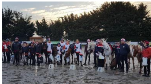
La remise des prix de l'épreuve Open

Le coup d'envoi de la saison du circuit Pony Mounted Games Tour (PMG Tour) a été les 16 et 17 mars à Corné (49). Avec 61 équipes engagées, l'équipe de Ghislain Deslandes a fait le plein pour un week-end convivial.