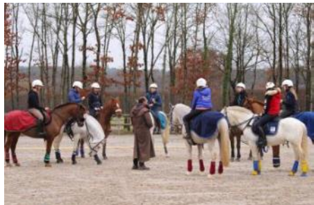
Les Cadets lors du stage fédéral en janvier autour du sélectionneur national, Raphaël Dubois.

La Fédération Française d'Équitation organise un stage équipe de France de horse-ball les 13 et 14 avril au Parc équestre fédéral à Lamotte-Beuvron (41). Les quatre catégories seront regroupées en Sologne avec un total de 56 joueurs. La FFE communique les cavaliers sélectionnés.