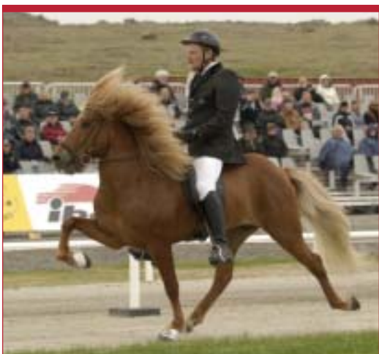
Les allures, ici le tölt, du cheval islandais peuvent être très spectaculaires

Depuis cette année, la FFE propose des Galops et des compétitions spécifiques pour l'équitation sur chevaux islandais. Gros plan sur une équitation pratiquée sur un petit cheval polyvalent et rustique.