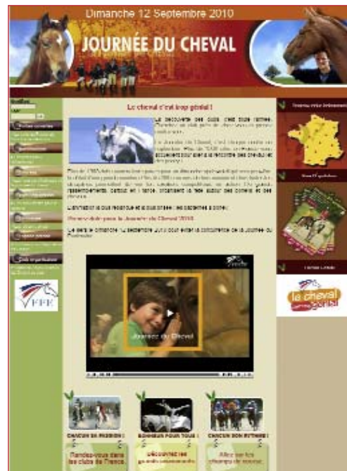
Vous pouvez mettre en ligne le clip de la Journée du cheval sur votre site Internet. Récupérer le lien sur FFE TV / Découvrir l'équitation .

Une page réseaux sociaux avec un lien sur Facebook, Twitter ou My FFE permet également d'étoffer le contenu et d'améliorer votre référencement.