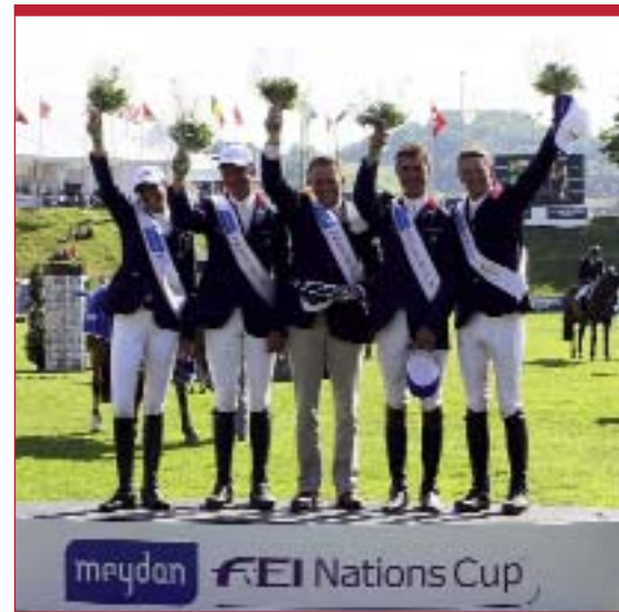
L'équipe de France sur le podium de St Gall