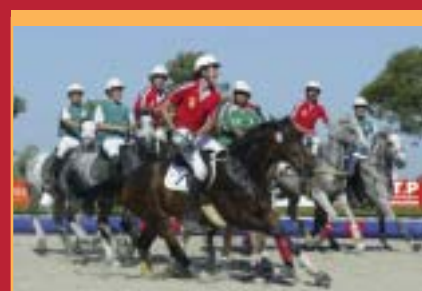
GRAND TOURNOI 2010

Après 3 victoires consécutives à la Baule, Rome et St Gall, la France caracole en tête de la Coupe des Nations . . . Page 10