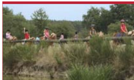
96% des Ecoles Françaises d'Équitation sont labellisées Poney Club de France

L'espace d'accueil : 90 % de satisfaction.