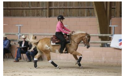
Équitation western.