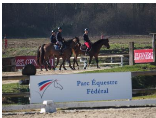
Regrouper les différentes catégories d'âge permet aux cavaliers de se côtoyer et créer une cohésion.