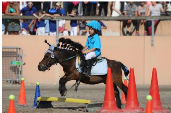
L'équifun séduit les enfants par son côté ludique.

La Fédération Française d'Équitation compte aujourd'hui 36 disciplines. Codifiées, celles-ci permettent aux poney-clubs et centres équestres de proposer une offre large adaptée à tous les projets équestres.