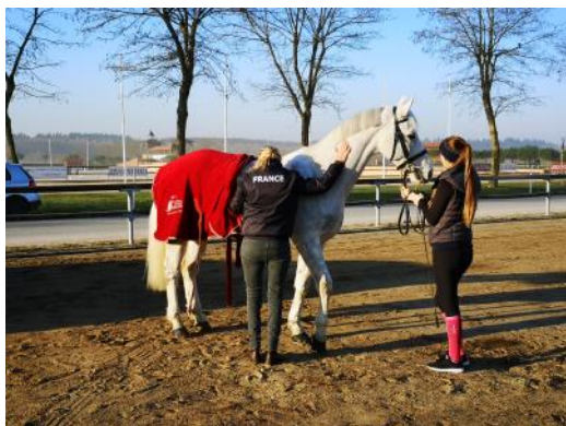
Les chevaux ont eu droit à un check-up vétérinaire avec Catherine Kitten.