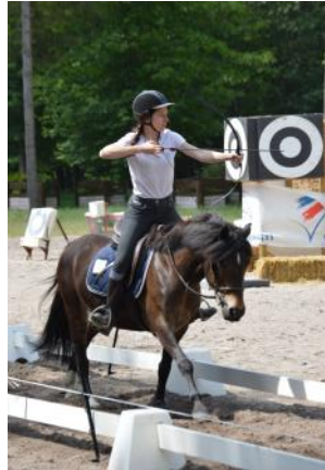
Tir à l'arc à cheval.