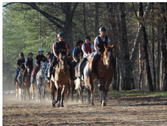
Les cavaliers peuvent profiter des jolies balades en forêt solognote.