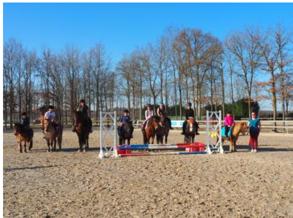
Les Écuries de Grace en stage au Parc équestre fédéral.

Les vacances scolaires permettent aux poney-clubs et centres équestres de la Fédération Française d'Équitation de profiter de la maison de famille des cavaliers : le Parc équestre fédéral. L'occasion pour eux et leurs élèves de profiter de cet outil de développement de l'équitation unique.