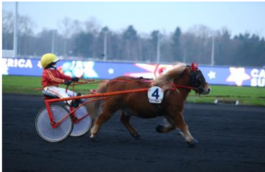
Trot attelé.