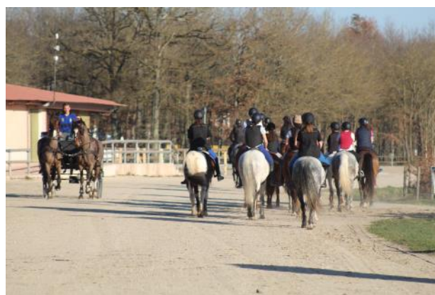
La capacité d'accueil du Parc équestre fédéral permet de voir toutes les disciplines et tous les niveaux se côtoyer.