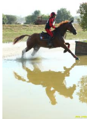
Concours complet.